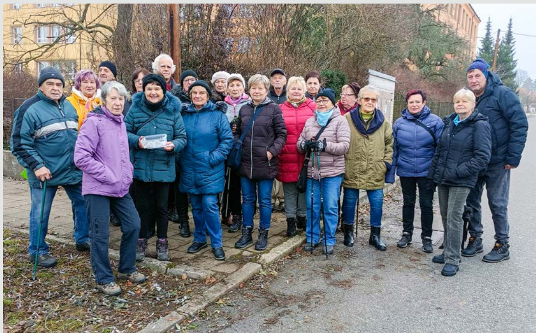
► Poslední vycházka KS Zastávka v roce 2023