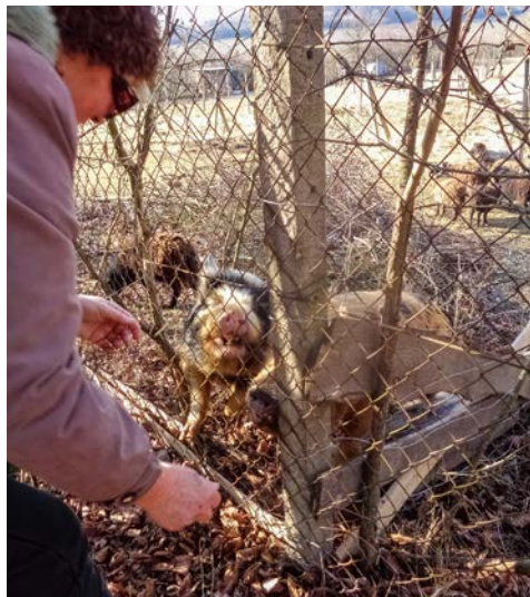
Hlína-Ivančice, foto B. Vinohradský