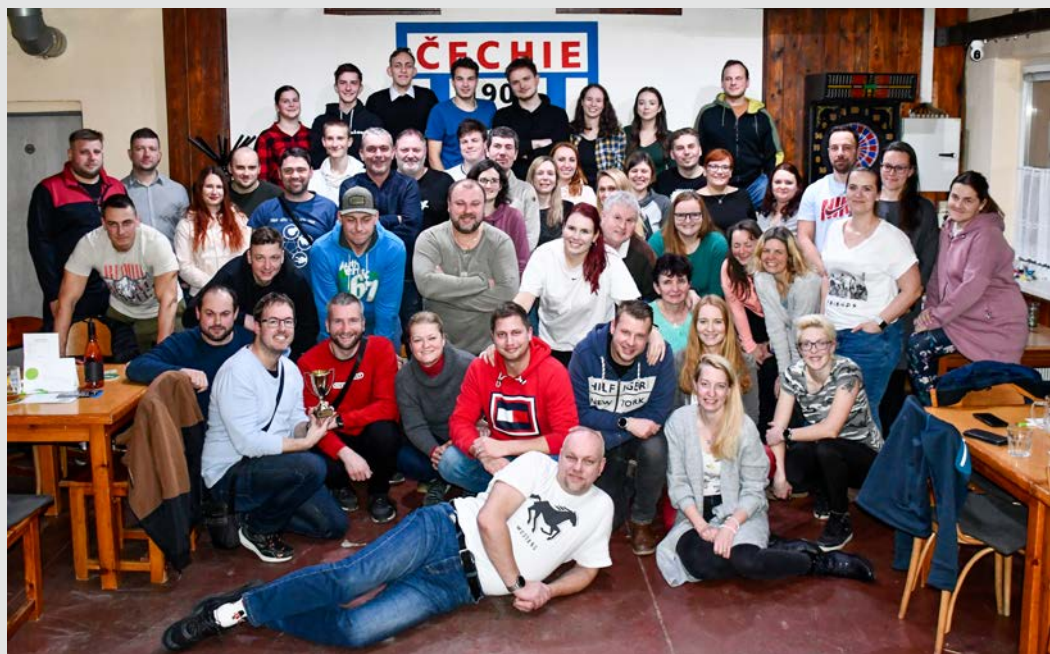
► Účastníci hospodského kvízu v Restauraci Stadion