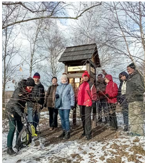
NS Halda Zbýšov