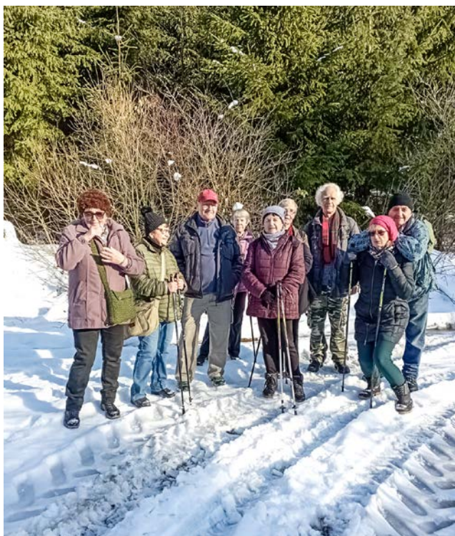
První zimní vycházka