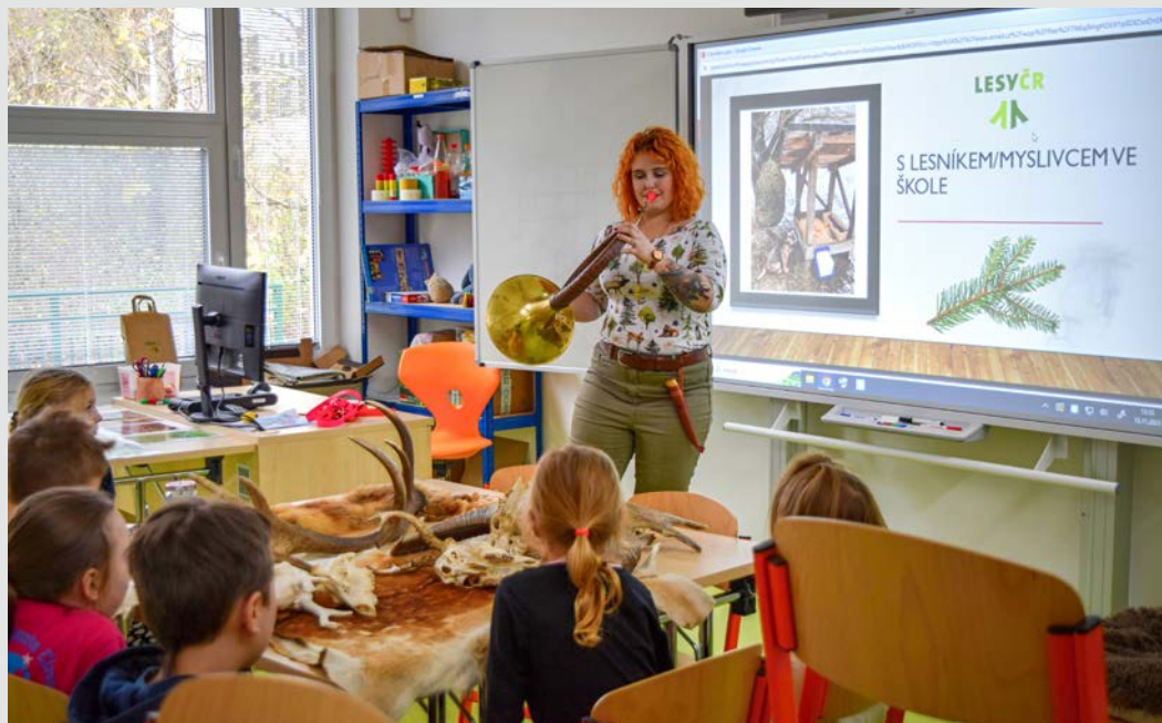
► Výukový program v DDM Zastávka