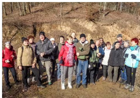
Údolí Martálského potoka