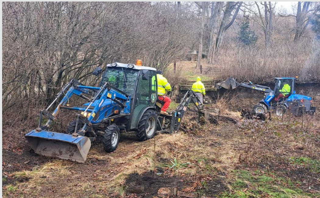
► Rychlá rota v akci