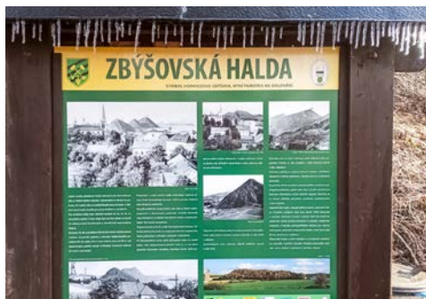
Ledové stalaktity – lednová vycházka